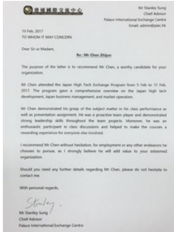
通國際交流中心首席顧問博士所頒發的項目推薦信 樣板