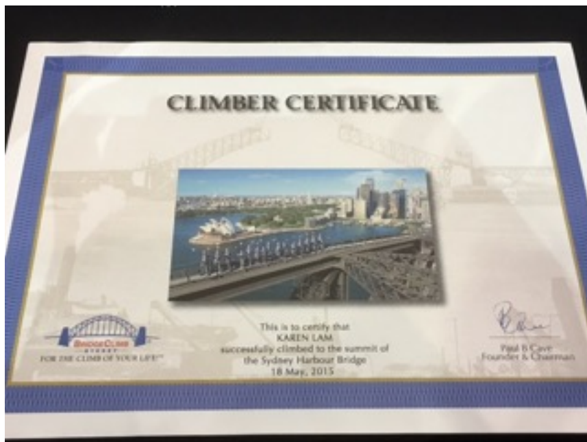
澳洲悉尼大橋Sydney Harbour Bridge 所頒發的Climber Certificate 樣板