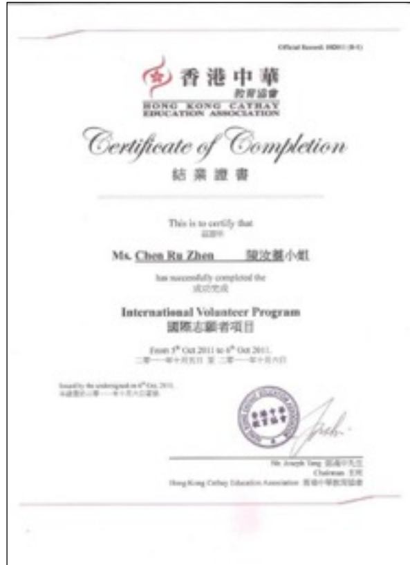
國際志願者項目證書 樣板